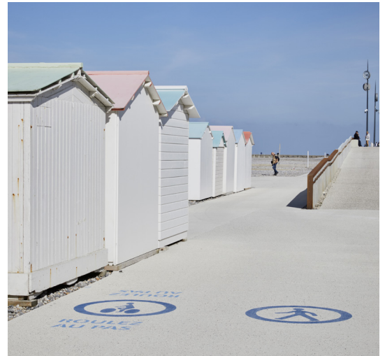
Esplanade basse Louis Aragon