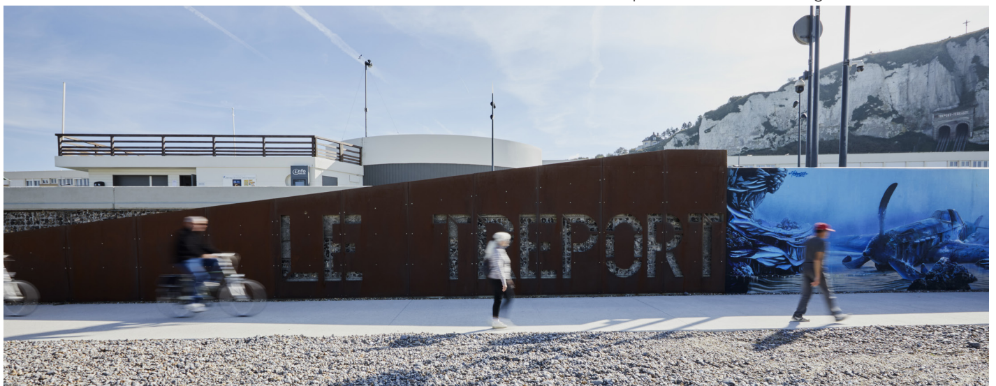
Esplanade de la plage