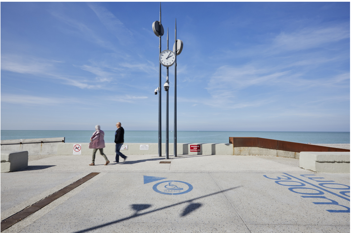
Esplanade haute Louis Aragon